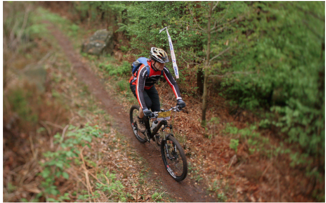
Linus im Kaisergarten

In altbekannter Weise wurde wieder im Abstand von je 5 Minuten in Fünziger-Blöcken gestartet (die Veranstaltung war allerdings kein Rennen!). Wir sechs noBrakes-Radler starteten gemeinsam im zweiten Startblock (Nochmals vielen Dank an das Orga-Team – was eine Mail so alles bewirken kann). Wie in den letzten Jahren war das erste Ziel der „Kaisergarten“. Der Regen der letzten Tage hatte die Strecke ziemlich aufgeweicht und so wurde dieser Anstieg mit 350 Höhenmeter zur ersten Plackerei des Tages. Jedoch war diese recht schnell vergessen, als es auf einem der schönsten Trails der Strecke über ca. fünf Kilometer wieder bergab ging. Über den „Freien Platz“ und ein paar Trails später erreichten wir die erste Verpflegungsstelle in Frankenthal. Hier erwartete uns natürlich wieder Hefezopf in rauen Mengen und dieses Jahr überraschte uns der Lambrechter Gäsbock mit Gäsbock-Milch (Batida de Coco... Doping auf höchstem Niveau).