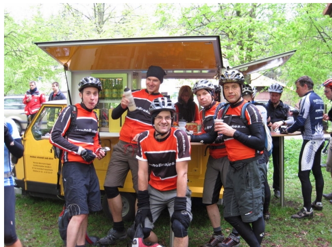
Die noBrakes-Radler an der 2. Verpflegungsstelle

Dabei wurde doch nach nur ein paar Kilometern auf ganz besondere Weise für das leibliche Wohl gesorgt: