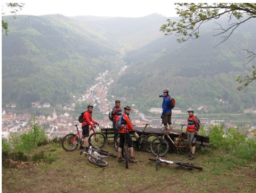
Vor der letzten Abfahrt: Lambrechter Tal