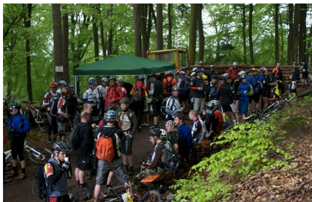
Sonderverpflegung (Foto: www.bike-pfalz.de )

Es folgte nun eine lange unspektakuläre Abfahrt auf Waldautobahnen in Richtung Breitenstein. Doch Kenner wussten, das schlimmste kommt erst: Ein langer, steiler Anstieg mit ca. 10% Steigung. Nun galt es die letzten 350 Höhenmeter vor der letzten, heiß ersehnten Sonderverpflegung zu bezwingen. Und wieder hatten sich alle Mühen gelohnt. Die Sonderverpflegung bei Kilometer 70 war wieder ein absolutes Highlight. Auch dieses Jahr hatten die Veranstalter vom Feinsten aufgetischt: Schinken, Salami, Käse, Weißbrot... und erst die Getränkekarte! Pfälzer Weiß- und Rotwein, Bier (mit und ohne „Umdrehung“), Radler, Hefeweizen... Das musste einfach genossen werden.